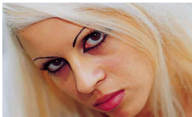
S filmi, ki imajo povdarnjene barve se izogibajte portretne fotografije. Predvsem Provia F pri močni sončni svetlobi in rahli podosvetlitvi popolnoma izgubi kontrolo nad rdečim barvnim spektrom.

Na vaša stalna vprašanja, kateri film izbrati pa ni odgovora. Odvisno je od vašega žepa glede cene filma in predvsem vašega videnja barv. Tudi vam ljubi motivi se z drugimi filmi lahko producirajo drugače. Zato preiskusite več filmov in ob primerjavi istih fotografij, bo izbira mnogo lažja.