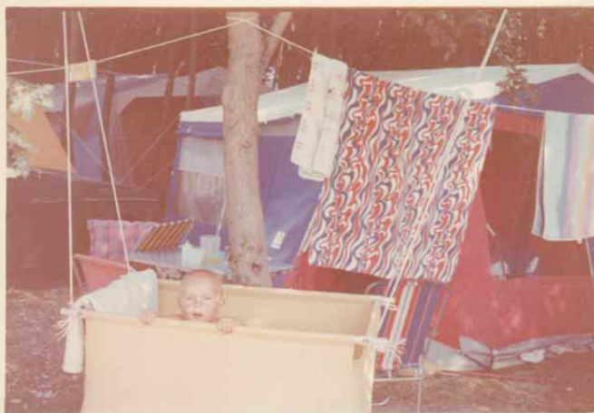
28 let stara fotografija, posneta s kamero Smena 8, na negativni film ORWO 18DIN in narejena na papirni osnovi z za tiste čase modnim robom. Slika je pod delovanjem svetlobe in kemikalij z leti precej izgubila na barvitosti in kontrastu.

Če pa bi si tudi vi želeli fotografije spraviti v računalnik, pa ga še nimate, fotografije vseeno skrbno shranite za čas, ko ga boste imeli, v naslednjih člankih pa si boste lahko prebrali, kakšen računalnik potrebujete.