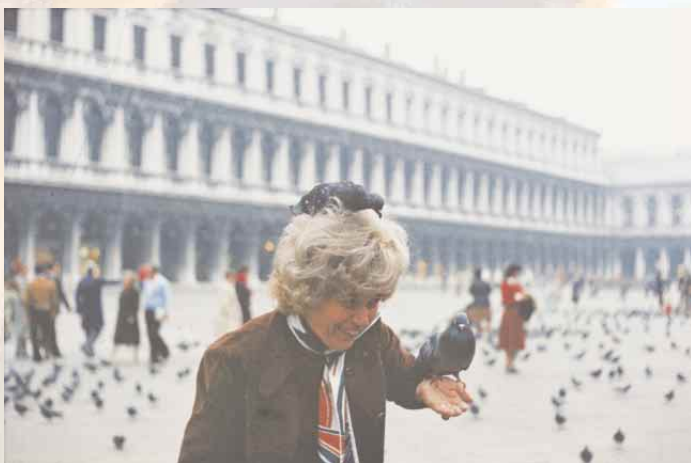
20 let stari diazitiv, posnet na dia filmu ORWO s kamero Praktika PLC2. Že takrat je bil posnetek zaradi slabega vremena barvno in kontrastno slab.