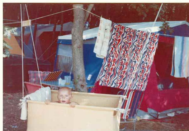
Ista fotografija poskanirana in barvno obdelana v računalniku. Popravljen je tudi rob fotografije.